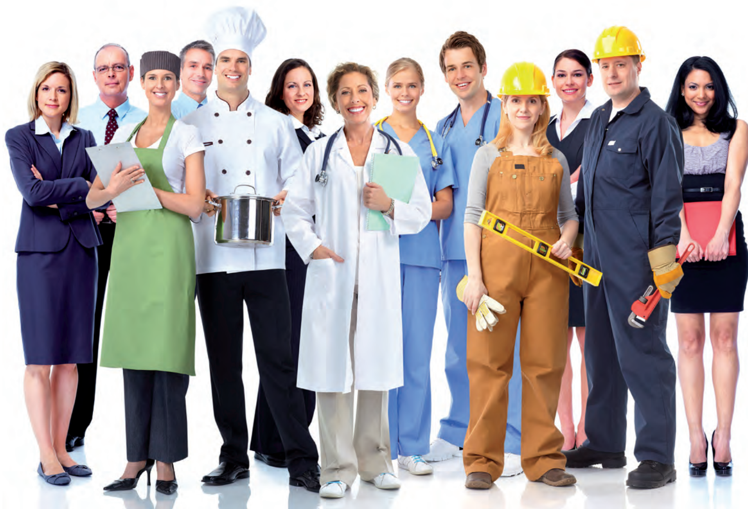
Abb.: © Kurhan / shutterstock.com